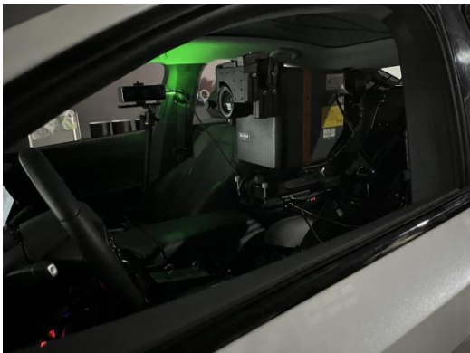
一般要求试验数据采集