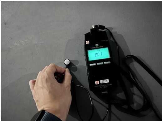
一般要求试验环境

本次参与验证试验的样车分别来自东软、赛力斯、比亚迪3家企业，自2024年10月起，在中汽研汽车检验中心（天津）有限公司开展一般要求相关验证试验。本次参与验证试验的样件分别来自华为、泽景、未来（北京）黑科技有限公司、福耀等企业，其中福耀提供玻璃制品，自2024年10月起，在中汽零部件技术（天津）有限公司开展图像性能要求相关验证试验。本次验证试验部分布置见图1，验证试验结果见表1。