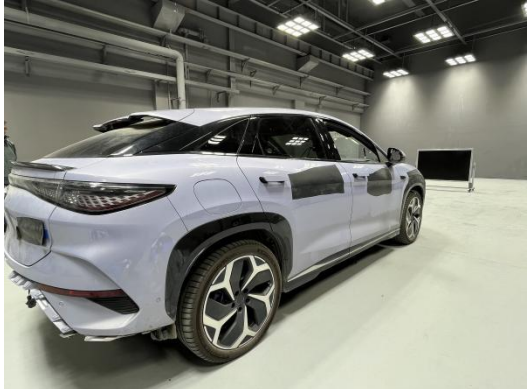
一般要求试验布置