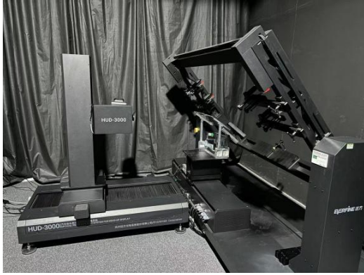
图像性能试验布置